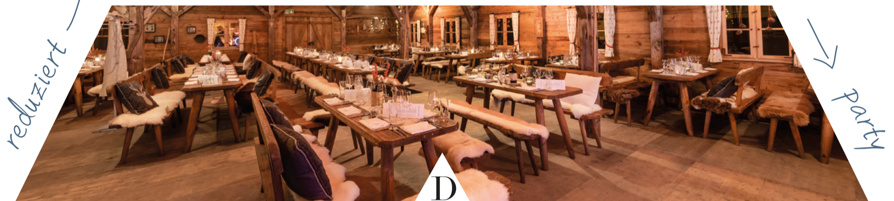
A B C D